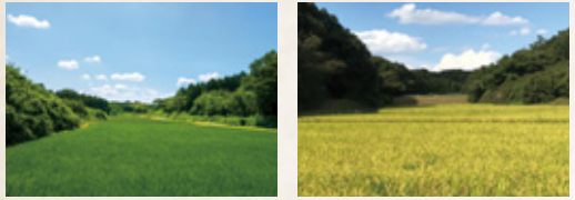
谷津田で穫れたお米は令和3年度埼玉県皇室献上米にも選ばれました。